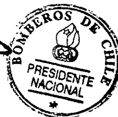
Miguel Reyes Núñez Presidente Nacional Bomberos De Chile